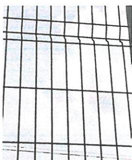
PRZYKŁADOWY PANEL OGRODZENIOWY