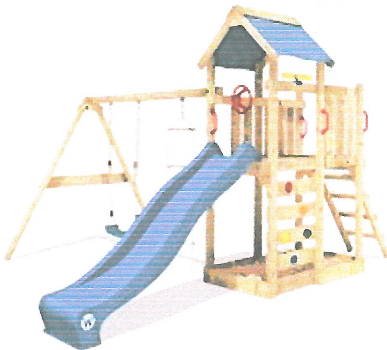
ZESTAW NA PLAC ZABAW