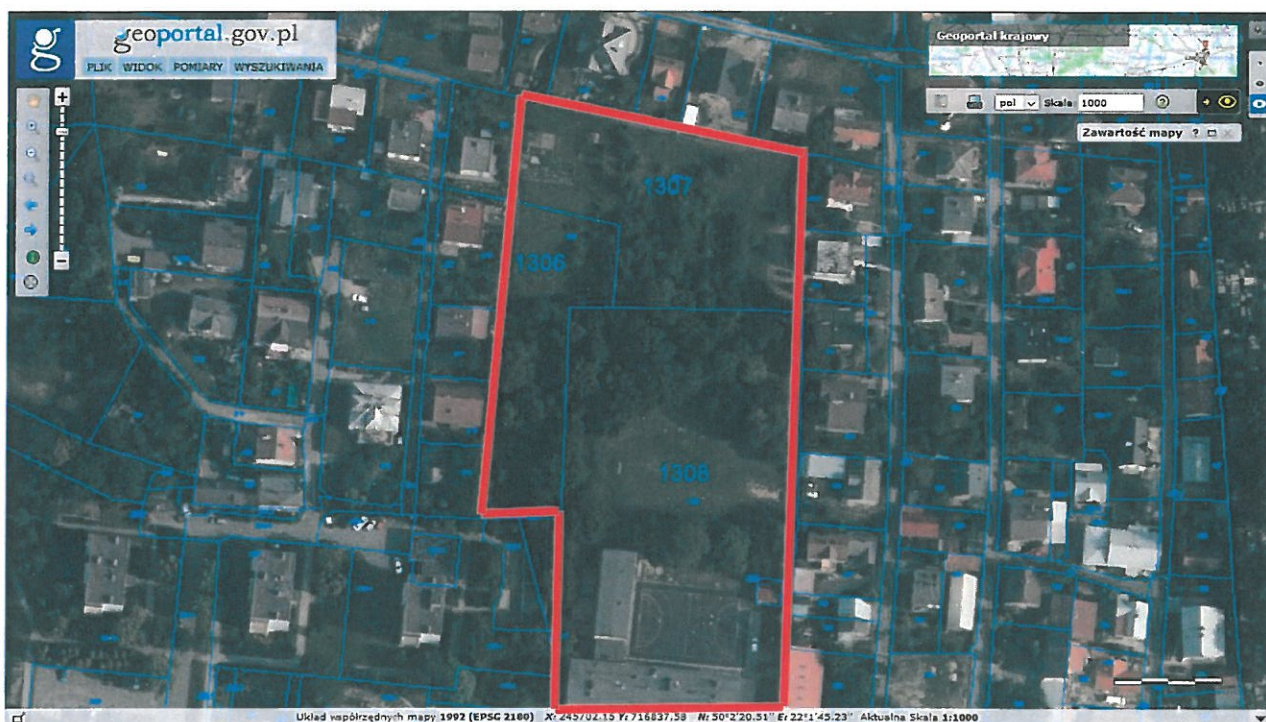
Rysunek 7 Działki do zwrotu wymienione w piśmie adwokata