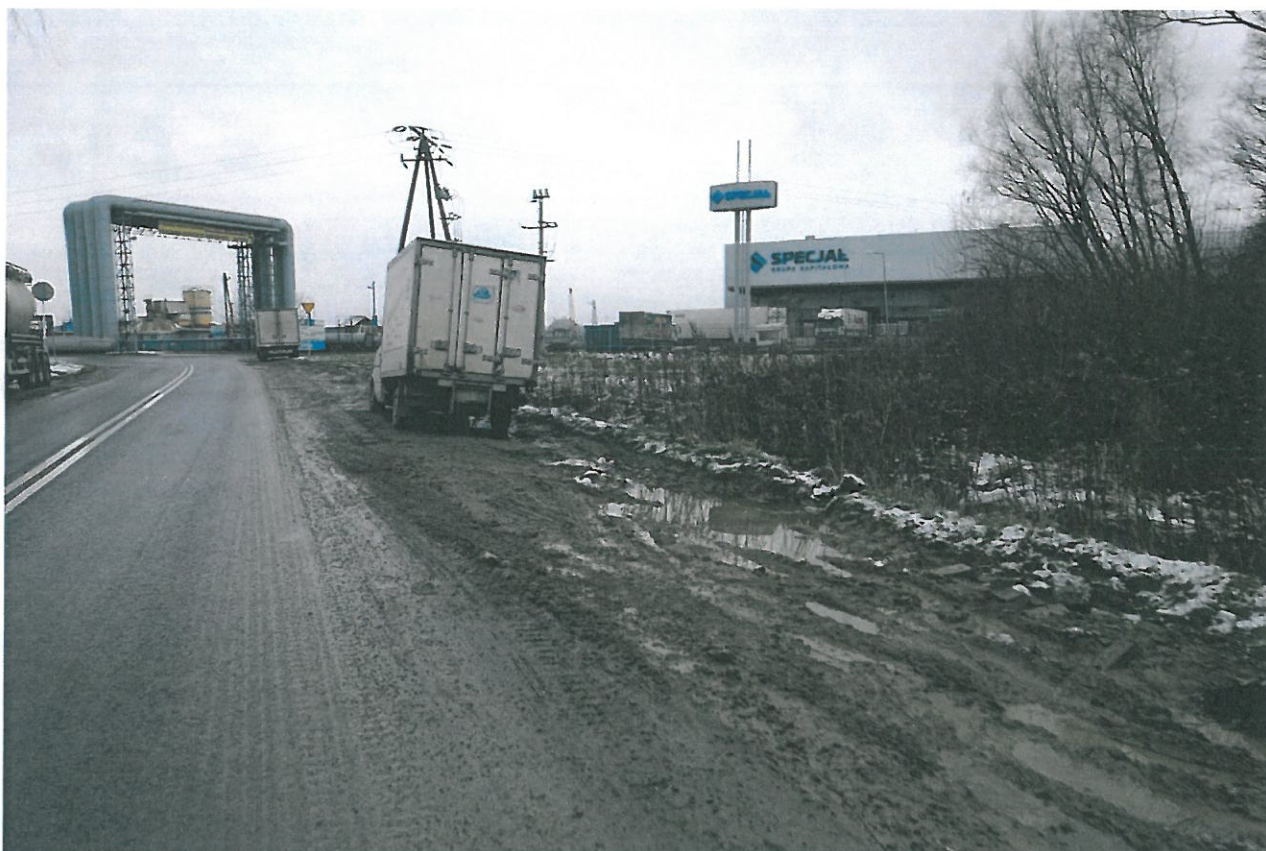
Rysunek 2. Ul. Ciepłownicza stacja Watkem

Proszę również o utwardzenie miejsca postojowego dla tirów które toną w błocie obok stacji benzynowej Watkem na Ul. Ciepłowniczej (wystarczy ułożyć stare betonowe płyty)