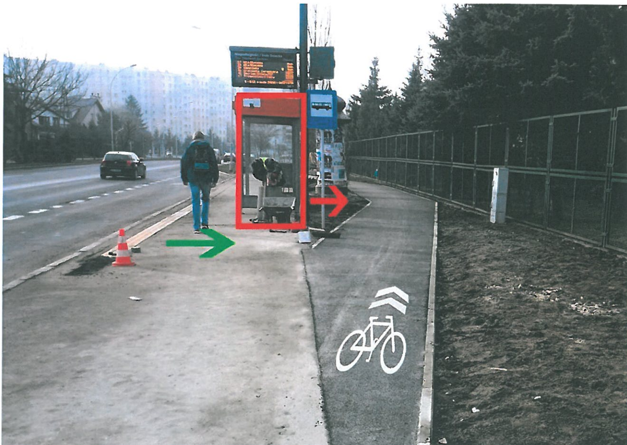
Rysunek 1. Ul. Niepodległości

Na ul. Niepodległości został wybudowany dwukierunkowy objazd dla rowerów za wiatą przystankową, ale uwolniła się przestrzeń pomiędzy wiatą a samym objazdem. Czy można przestawić wiatę przystankową bliżej objazdu dla rowerów (za zachowaniem 20 cm skrajni) zwiększając tym samym przestrzeń ruchu pieszych?