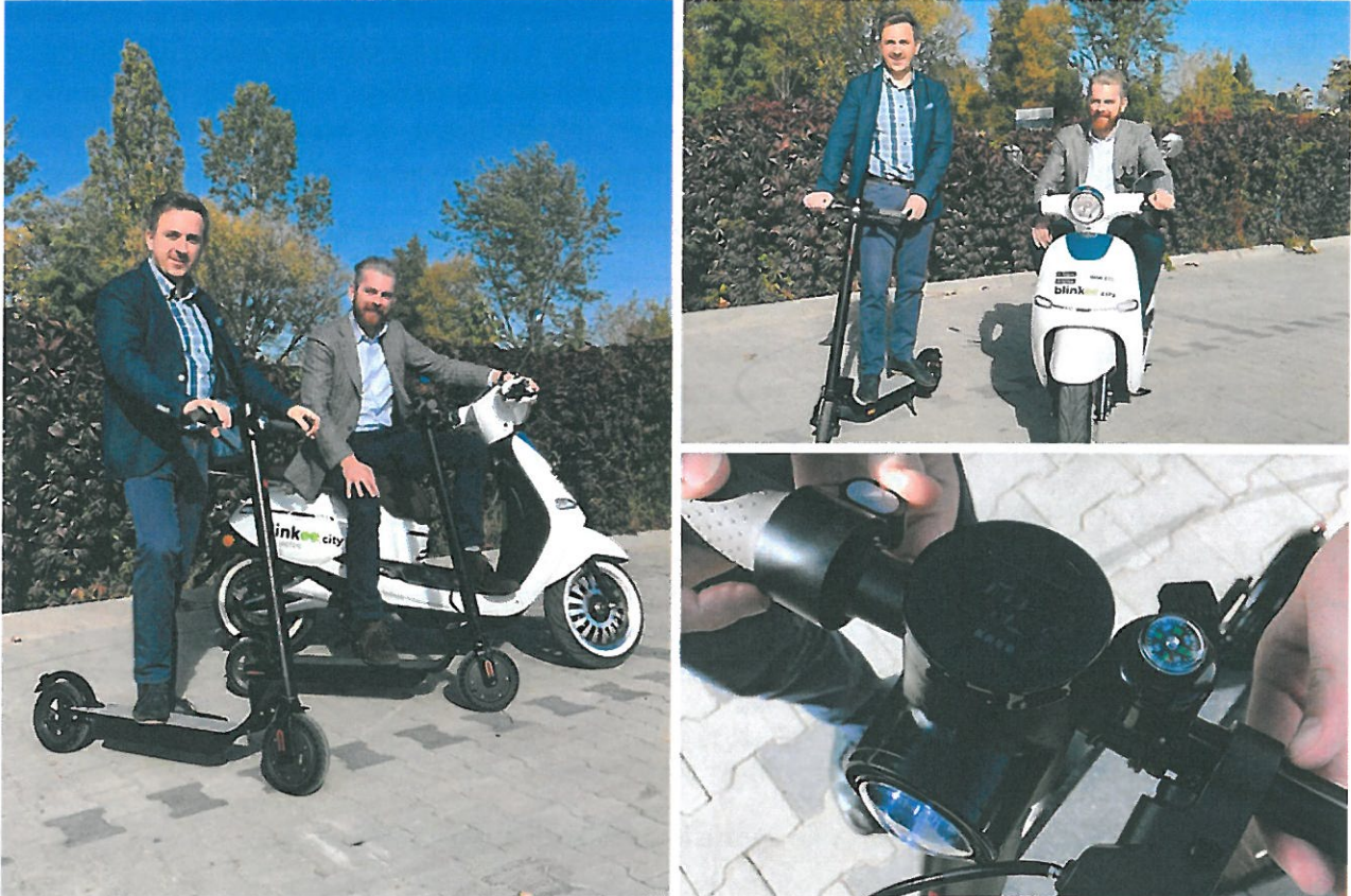
Rysunek 6. Przykład Hulajnogi elektrycznej, porównanie rozmiaru do skuterów elektrycznych działających w 2018 w Rzeszowie

Zwracam się z wnioskiem o rozważenie dodania do miejskiej wypożyczalni rowerów i skuterów elektrycznych opcji poszerzenia wypożyczalni o hulajnogi elektryczne. Hulajnogi elektryczne to najnowocześniejszy trend w poruszaniu się na krótkich dystansach, idealnie sprawdzi się w ścisłym centrum miasta. Jest to popularne w Warszawie, we Wrocławiu czy Poznaniu. Istnieje kilka firm które dostarczają tą technologię (Lime, Blink). Zmniejszy to podróże samochodem w ścisłym centrum miasta. Całość działa na zasadach IV generacji tzn. nie wymaga stacji bazowych.