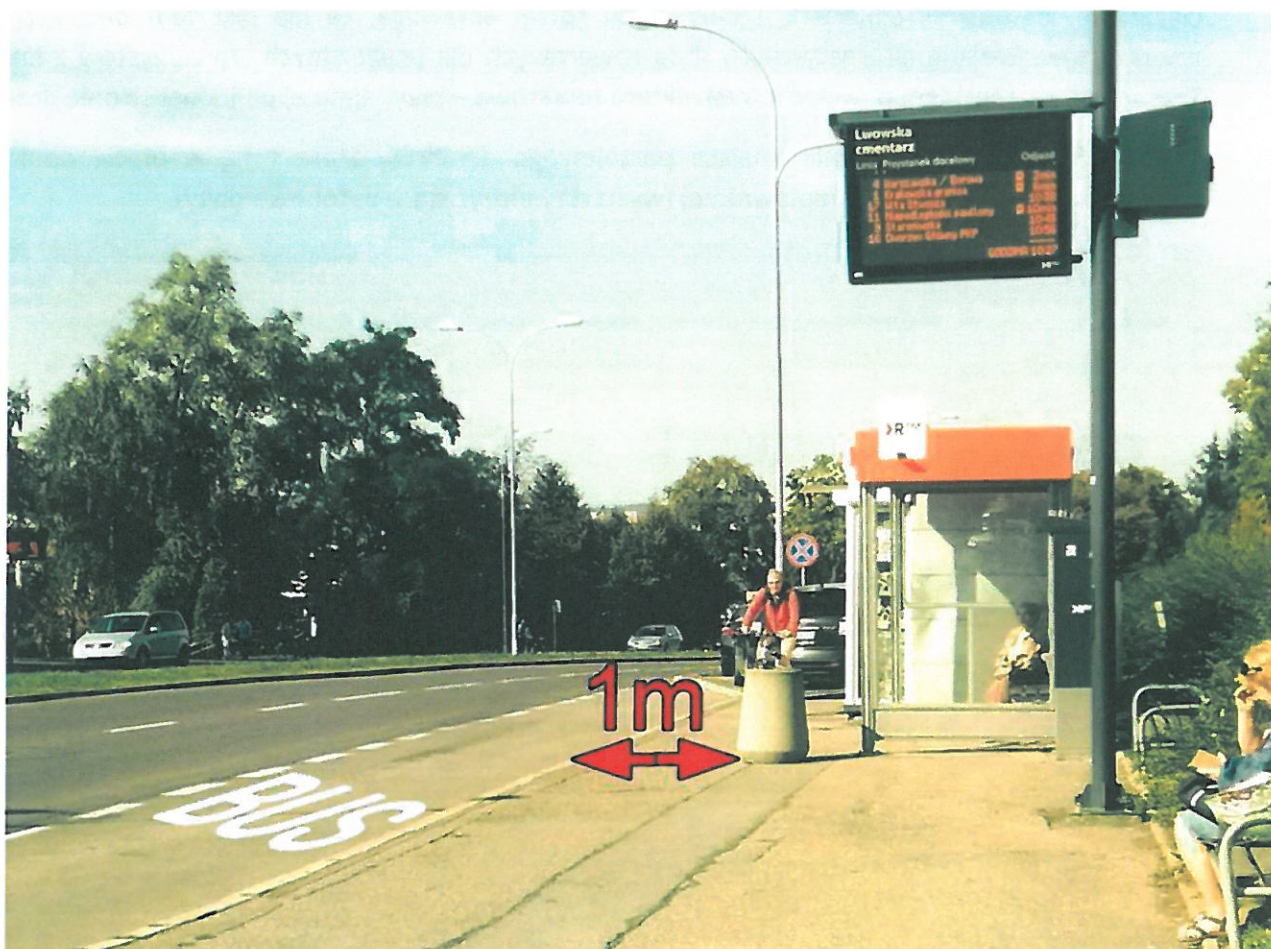
Rysunek 1. Ul. Lwowska

Zwracam się z wnioskiem aby z rozwagą stawiać małą architekturę miejską szczególnie w obrębie Ciągów Pieszorowerowych lub Dróg Dla Rowerów . Przepisy stanowią że takie obiekty nie mogą zagrażać bezpieczeństwu uczestników ruchu drogowego. Szczególnie niebezpieczne jest, gdy wysiadający z autobusu pasażerowie wchodzą pod koła jadącego rowerzysty po drodze dla rowerów, który nie ma gdzie uciec