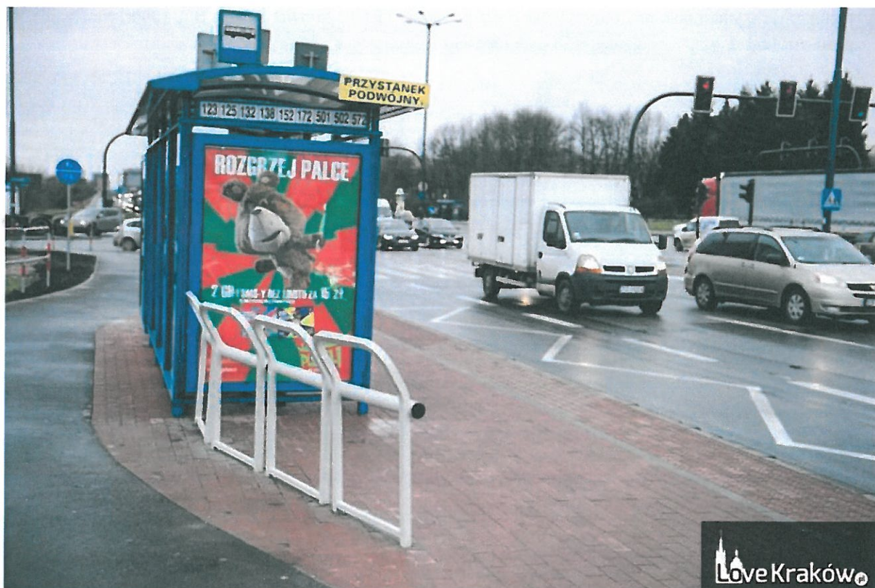
Rysunek 4. Przykład z Krakowa

Zwracam się z wnioskiem o zakup i montaż bariero-siedzisk dla pieszych żeby mieli gdzie przysiąść i żeby nie wchodzili na drogi rowerowe za przystanek. Bariery proponuję zamontować na ul. Rejtana, Lwowskiej od Ronda Pobitno na łańcut, na przystankach przy Politechnice Rzeszowskiej, oraz przy Stadionie Miejskim. Takie rozwiązania stosuje się np. w Krakowie