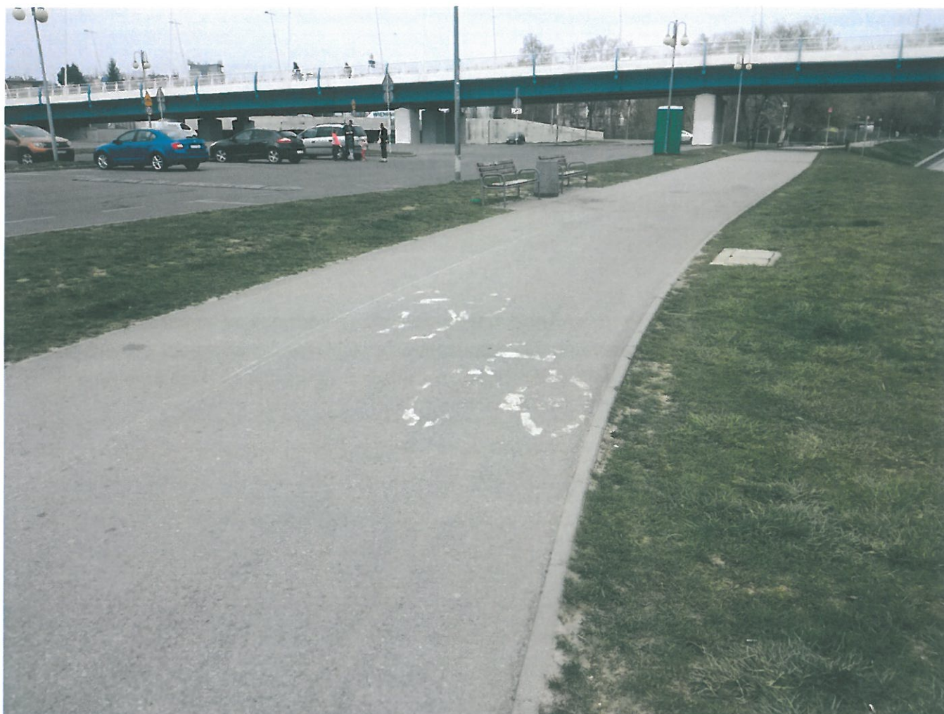
Rysunek 2. Oznakowanie poziome wymaga odnowienia