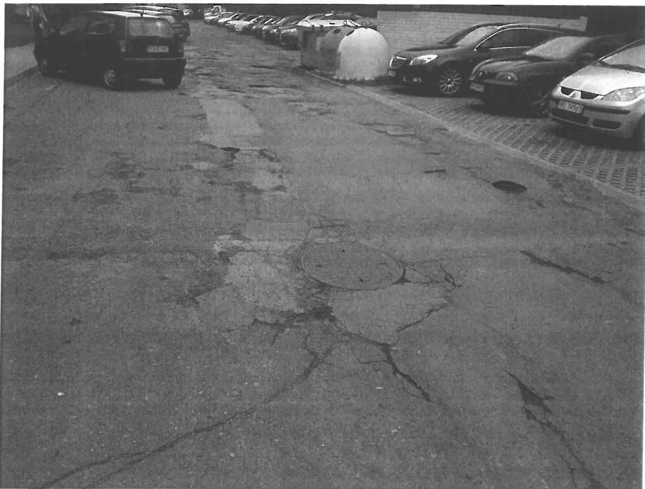
Rysunek 1. Głębokość dziur 10-13 cm, wymiany nawierzchni wymaga cały odcinek, łatanie nie ma sensu

Zwracam się z wnioskiem o remont drogi przy ul. Rejtana 14, z racji na liczne dziury wymienić należałby całą nawierzchnię.