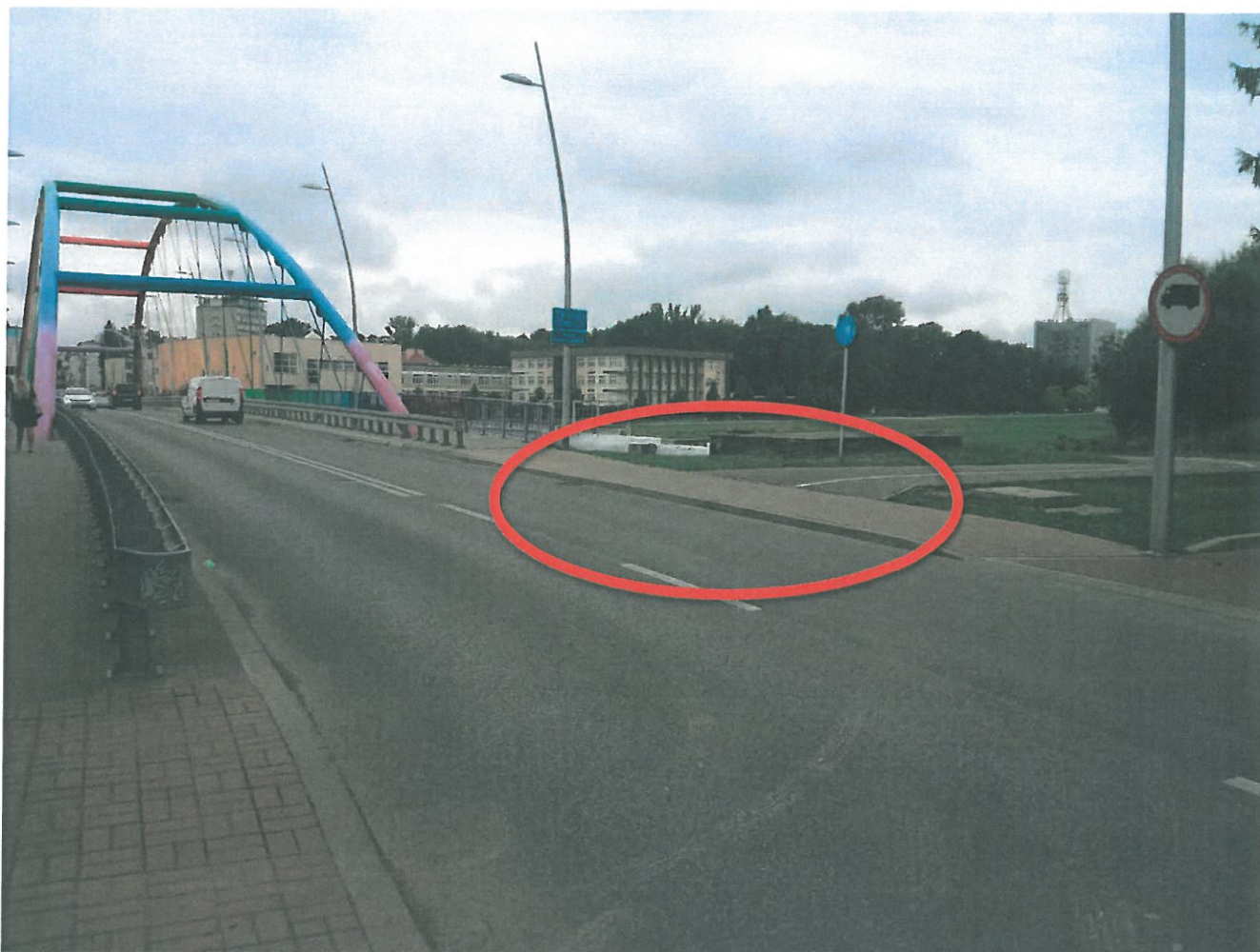
Most Narutowicza brak wjazdu dla rowerów