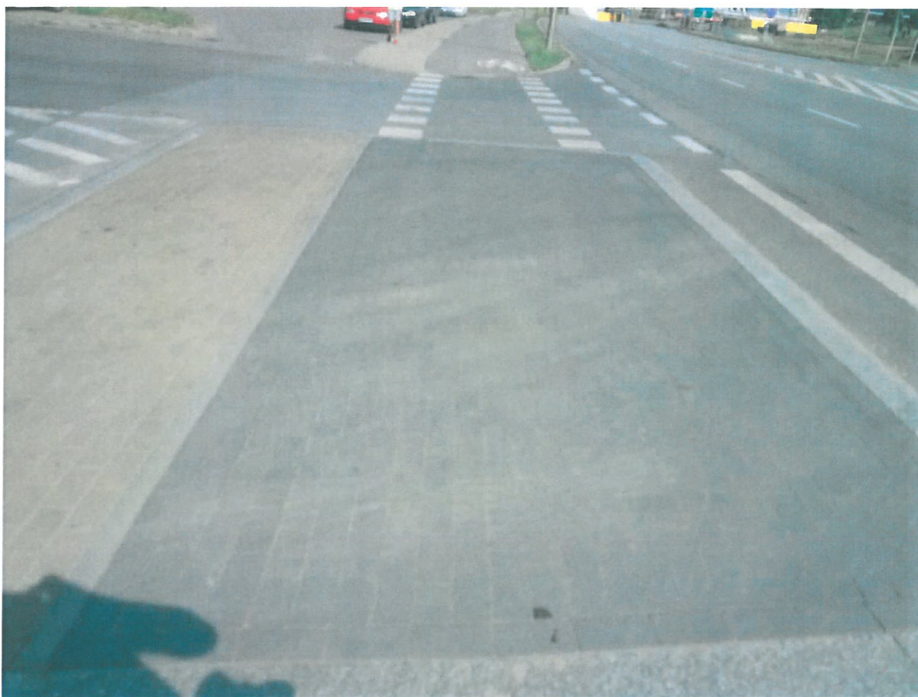
Wyspa na al. Wyzwolenia