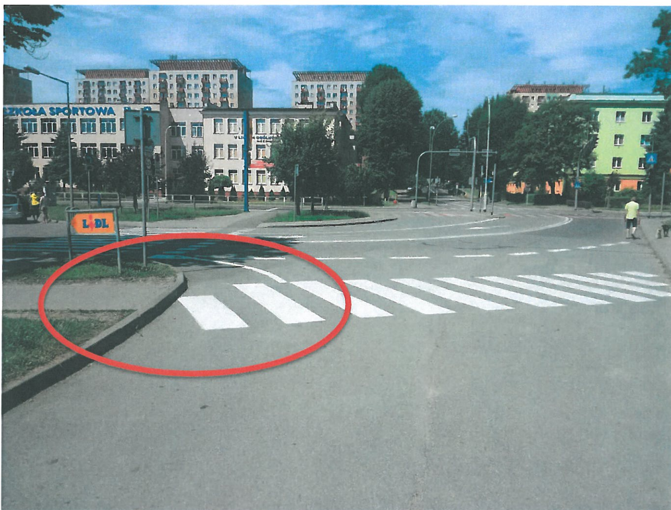
Zjazd na Bulwary od ul. Hetmańskiej