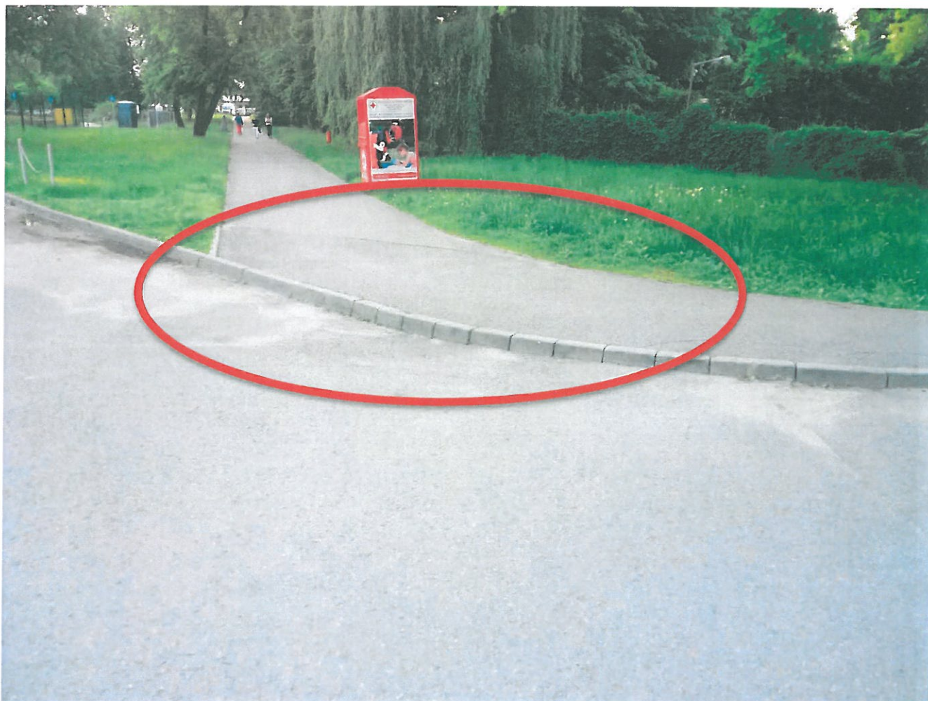
Dojazd do miasteczka ruchu drogowego