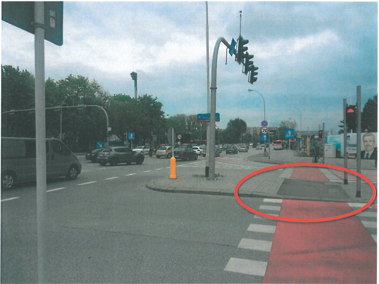
Hetmańska obok Stadionu Miejskiego