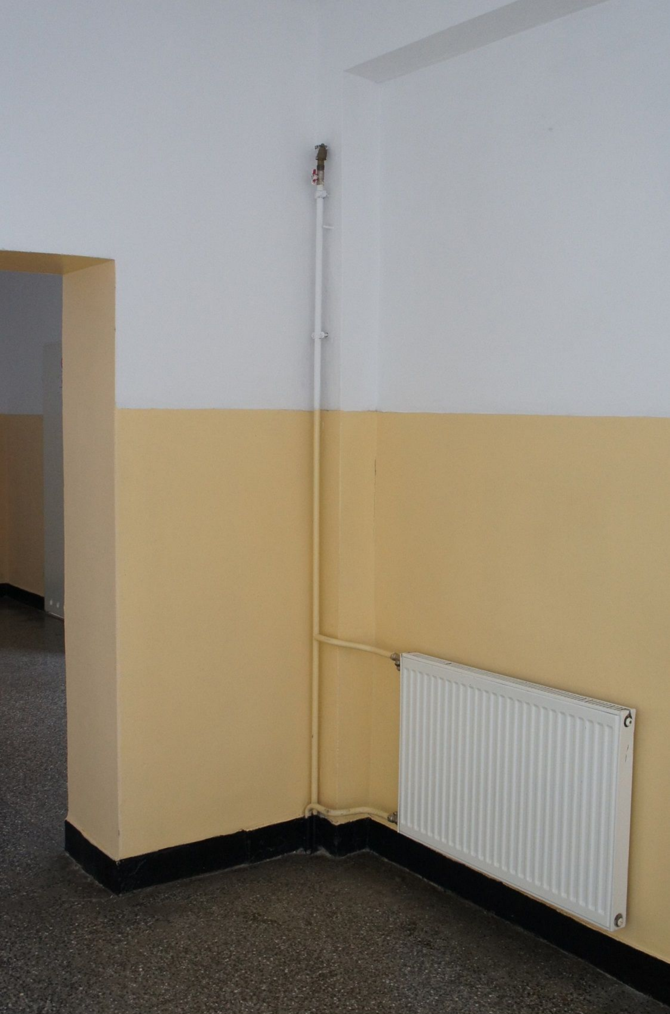
Planowane wejście do windy poziom nr 2