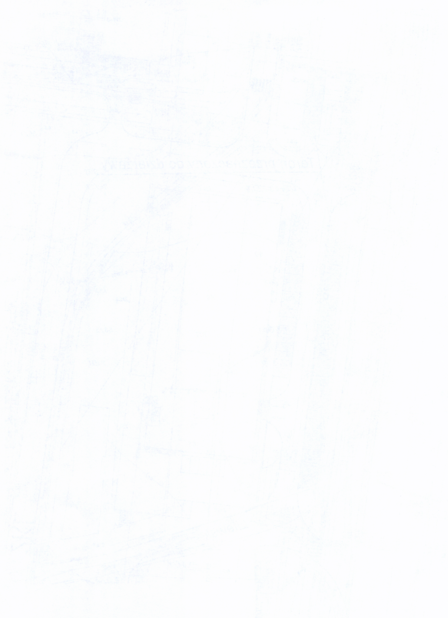
FIGURE 1. View of the grid.