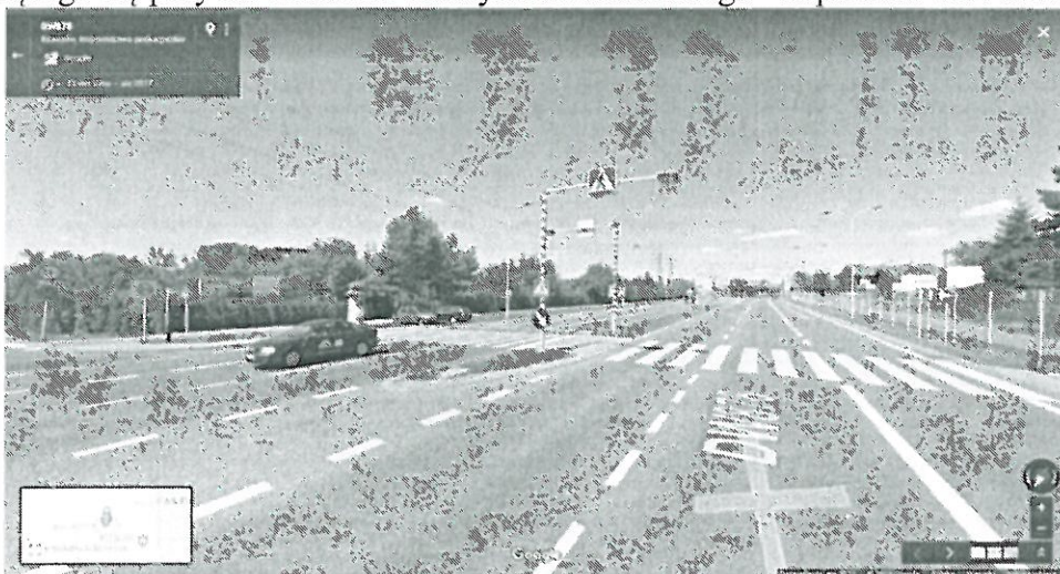
Al. Generała Władysława Sikorskiego - naprzeciw ul. Nowowiejskiej

W celu zapewnienia bezpieczeństwa mieszkańców Miasta Rzeszowa oraz osób przyjezdnych, zwracam się z wnioskiem o podjęcie działań zmierzających do realizacji inwestycji polegającej na montażu interaktywnej sygnalizacji na przejściu dla pieszych mieszczącego się przy al. Generała Władysława Sikorskiego - naprzeciw ul. Nowowiejskiej.