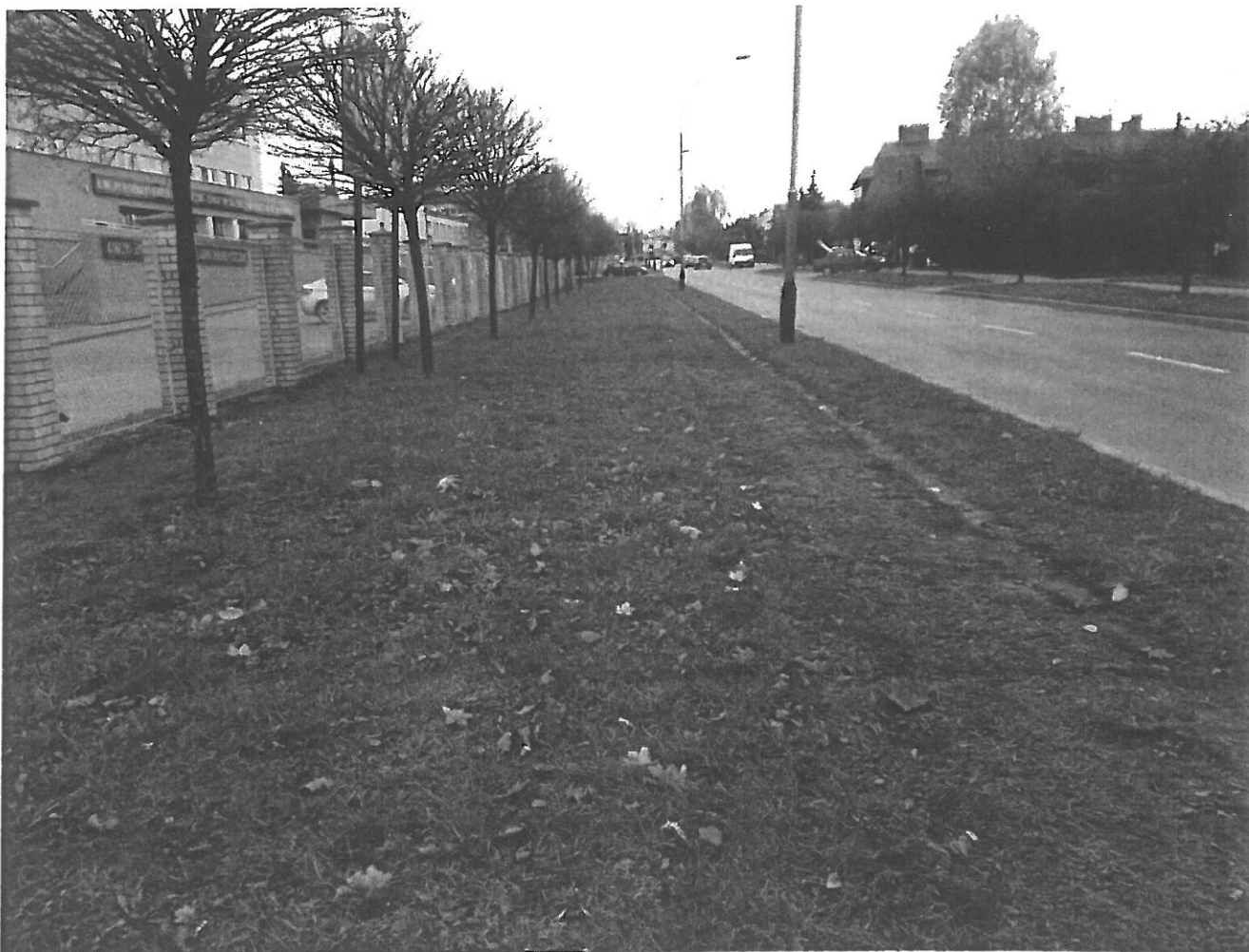
Rysunek 1. Ul. Leszka Czarnego – propozycja budowy ciągu pieszo - rowerowego

Wydreptana ścieżka przy ul. Leszka Czarnego: