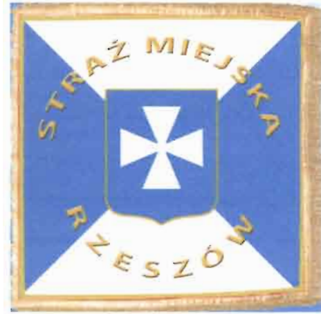
Rys. 2. Rewers