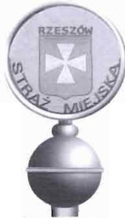
Rys. 3. Głowica