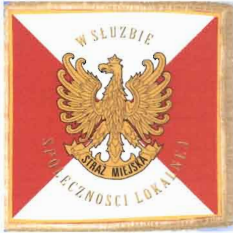
Rys. 1. Awers