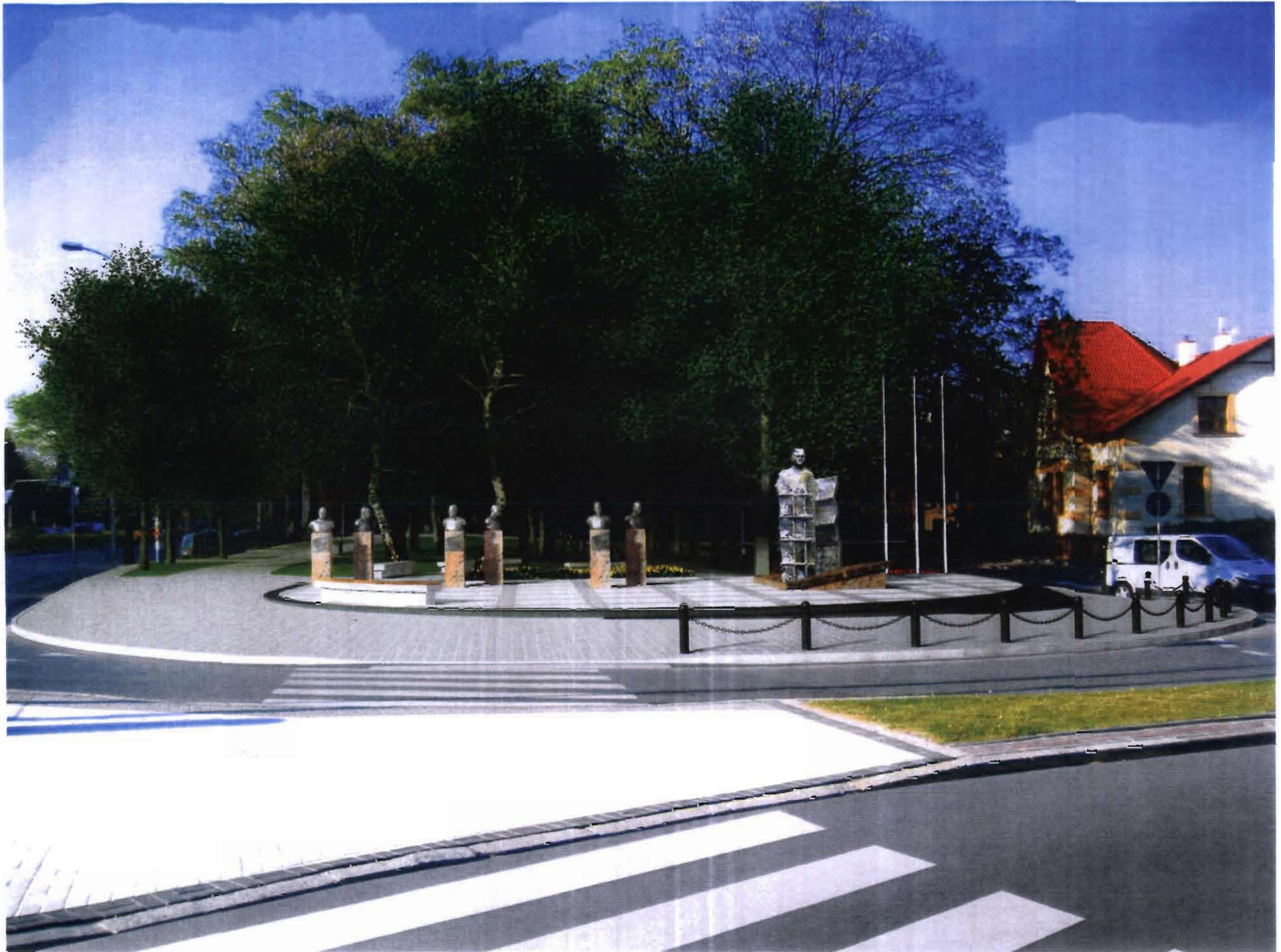
BUDOWA POMNIKA PRZEŁ. KUKASZA CIEPKIŃSKIEGO PRZY UL. CIEPKIŃSKIEGO