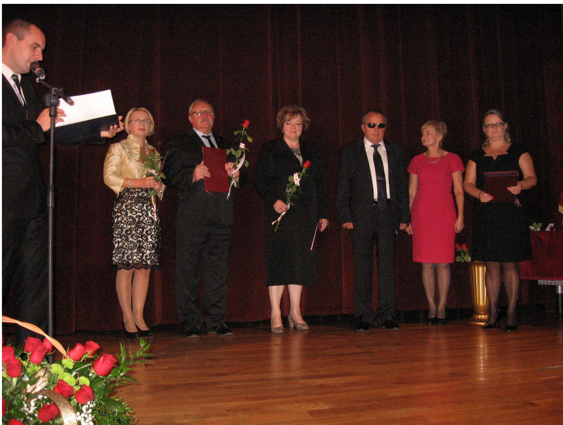
Zdjęcie nr 15. Z uroczystości jubileuszowej 60 rocznicy powstania Okręgu Podkarpackiego Polskiego Związku Niewidomych w Rzeszowie (2012 r.).