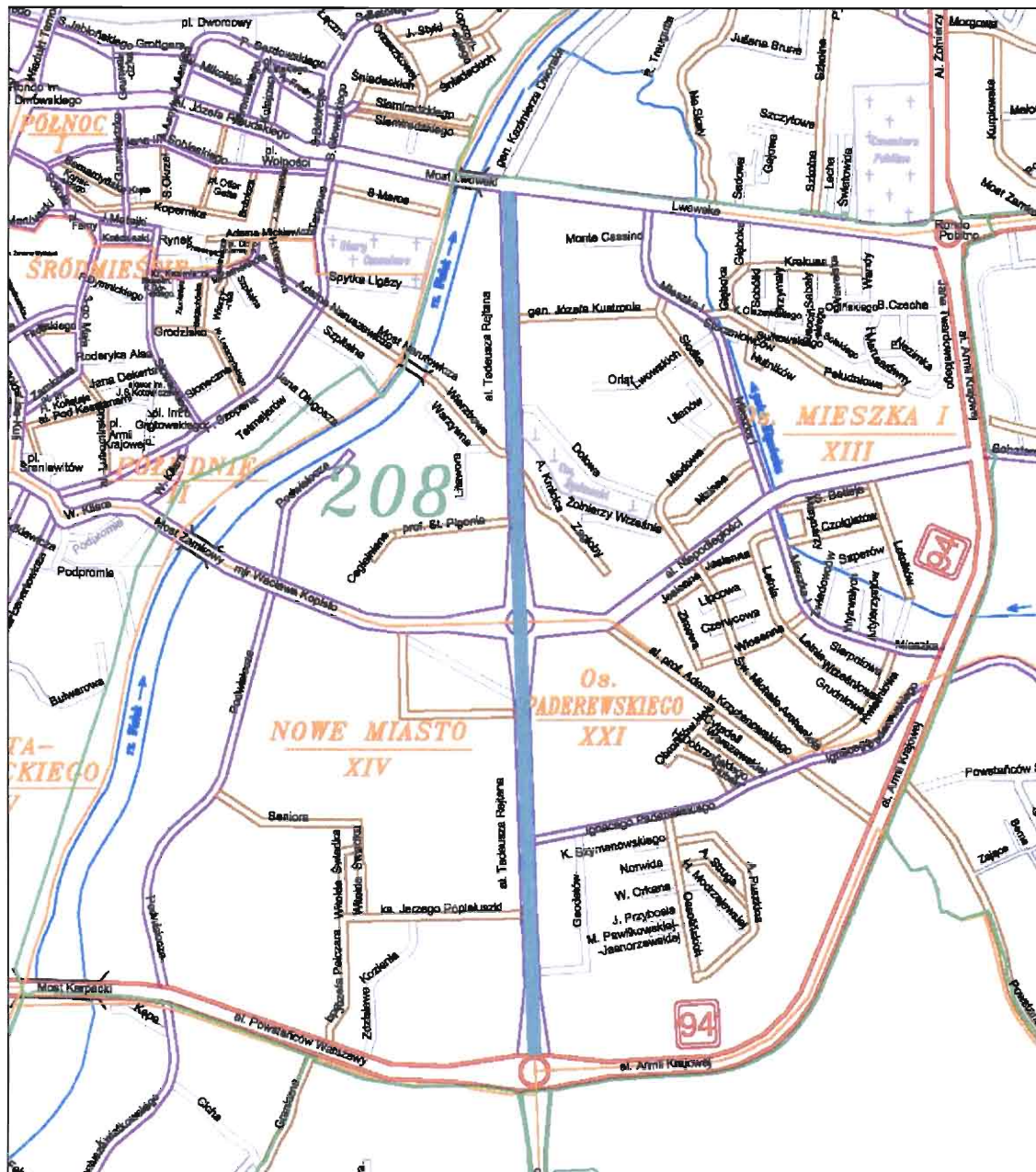
al. Tadeusza Rejtana - pozbawiana kategorii drogi powiatowej

Załącznik do Uchwały nr XXVIII/618/2016 Rady Miasta Rzeszowa z dnia 12 lipca 2016 r.