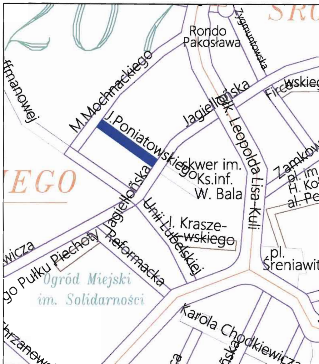
ulica Józefa Poniatowskiego - na odcinku od ul. Jagiellońskiej do ul. Maurycego Mochnackiego

Załącznik do uchwały nr XXXV/766/2016 Rady Miasta Rzeszowa z dnia 20 grudnia 2016 r.