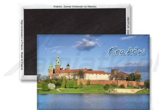
Zdjęcie przykładowego produktu spełniającego wymogi opisu