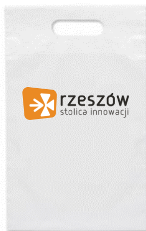
Zdjęcie przykładowego produktu spełniającego wymogi opisu