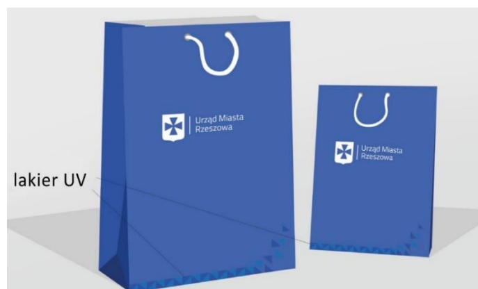
Projekt – Urząd Miasta Rzeszowa

Wykonanie zgodnie z przesłanym przez Zamawiającego projektem.