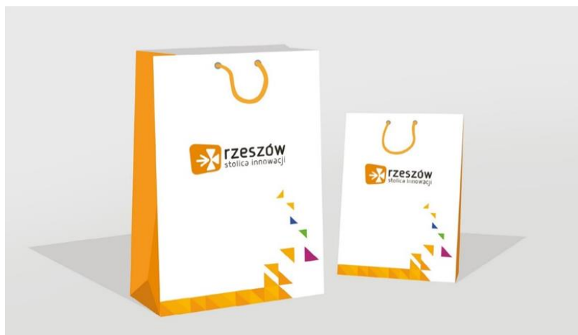
Projekt – Urząd Miasta Rzeszowa

Wykonanie zgodnie z przesłanym przez Zamawiającego projektem.