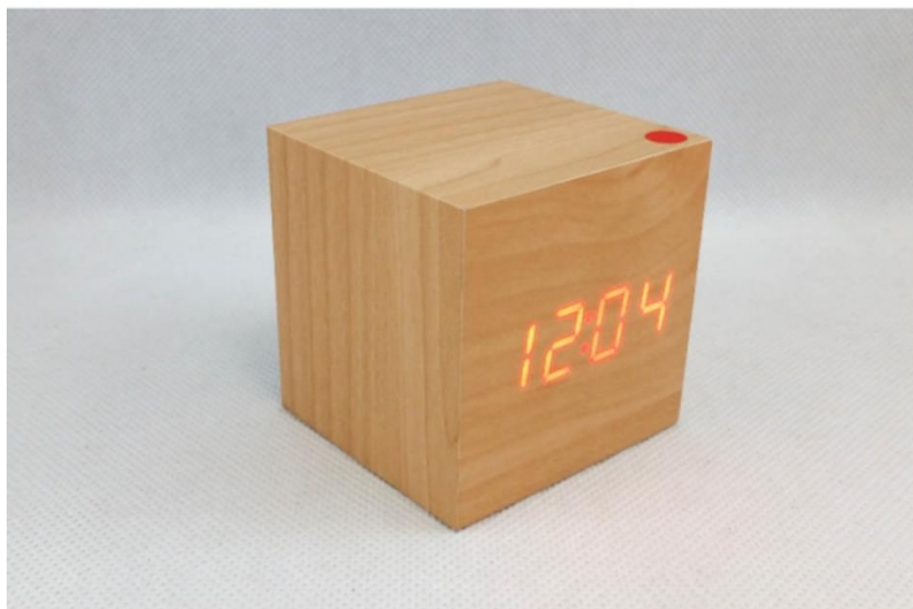
Zdjęcie przykładowego produktu spełniającego wymogi opisu