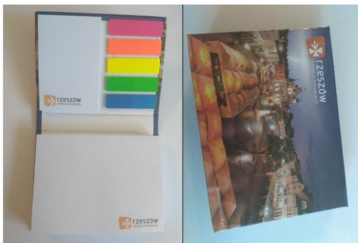
Zdjęcie przykładowego produktu spełniającego wymogi opisu