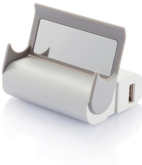
Zdjęcie przykładowego produktu spełniającego wymogi opisu