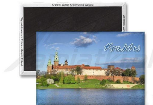
Zdjęcie przykładowego produktu spełniającego wymogi opisu