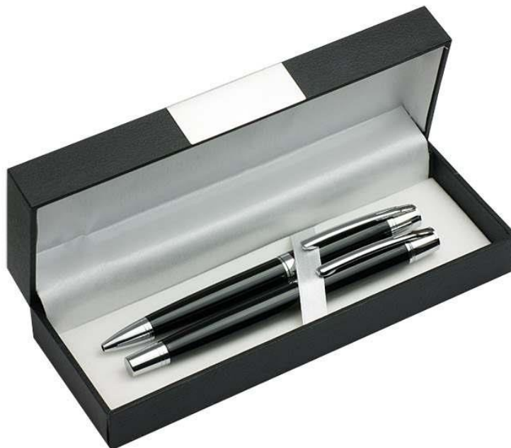
Zdjęcie przykładowego produktu spełniającego wymogi opisu