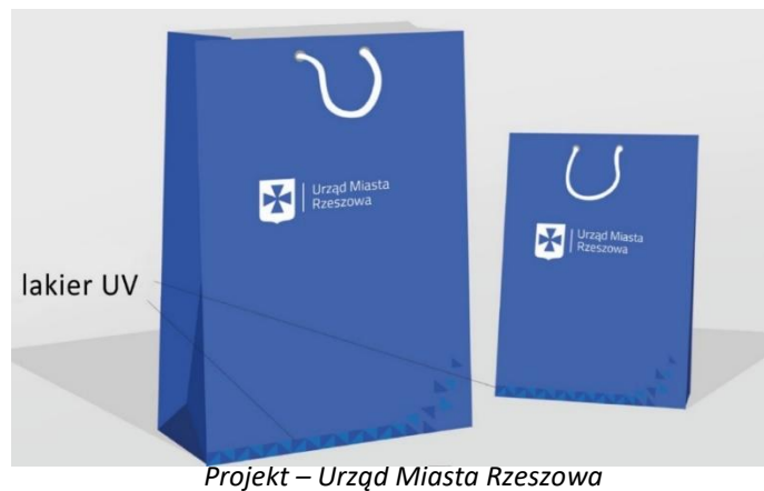
Projekt – Urząd Miasta Rzeszowa

Wykonanie zgodnie z przesłanym przez Zamawiającego projektem.