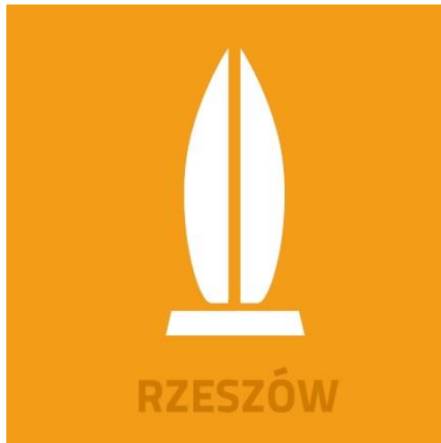
Projekt podkładki – Urząd Miasta Rzeszowa