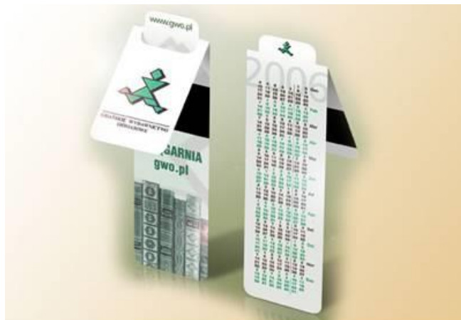
Zdjęcie przykładowego produktu spełniającego wymogi opisu