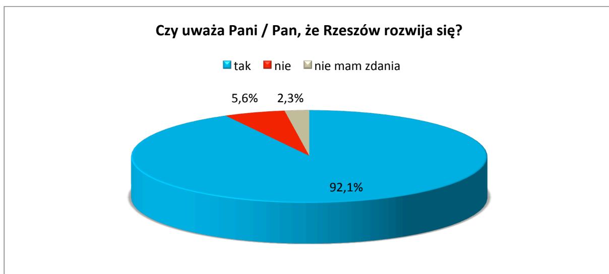
Ryc. 1. Czy Rzeszów rozwija się – odpowiedzi z ankiety internetowej.

W badaniu internetowym przygotowanym w związku z aktualizacją Strategii uzyskano 719 ankiet. Aż 92% respondentów uznało, że Rzeszów rozwija się, a w sumie 84,5% oceniło jakość życia w mieście jako dobrą lub bardzo dobrą.